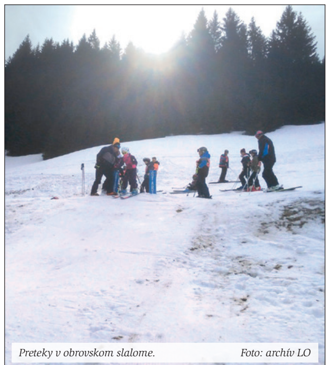
Preteky v obrovskom slalome.