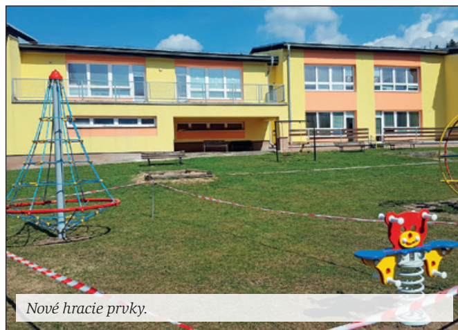
Nové hracie prvky.