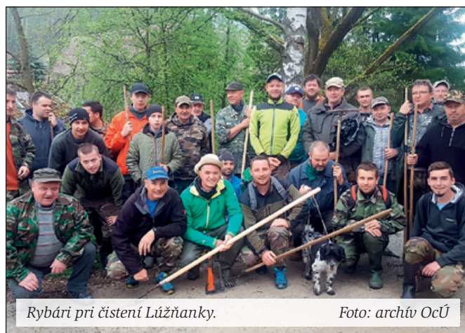
Rybári pri čistení Lúžňanky.