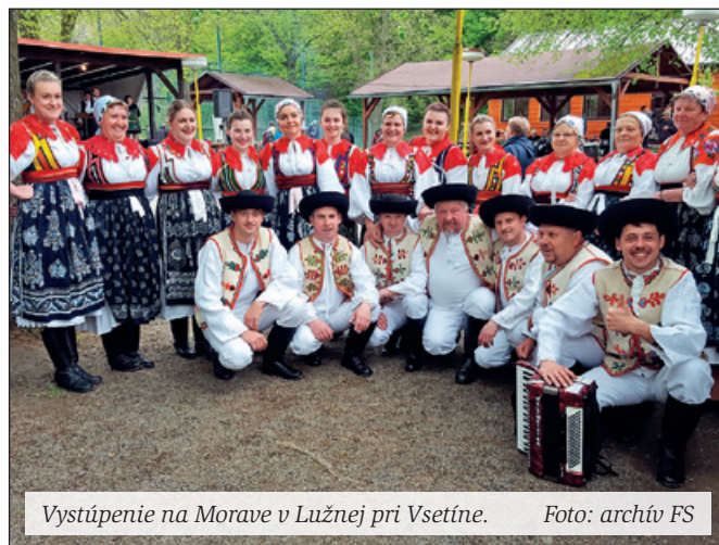
Vystúpenie na Morave v Lužnej pri Vsetíne.