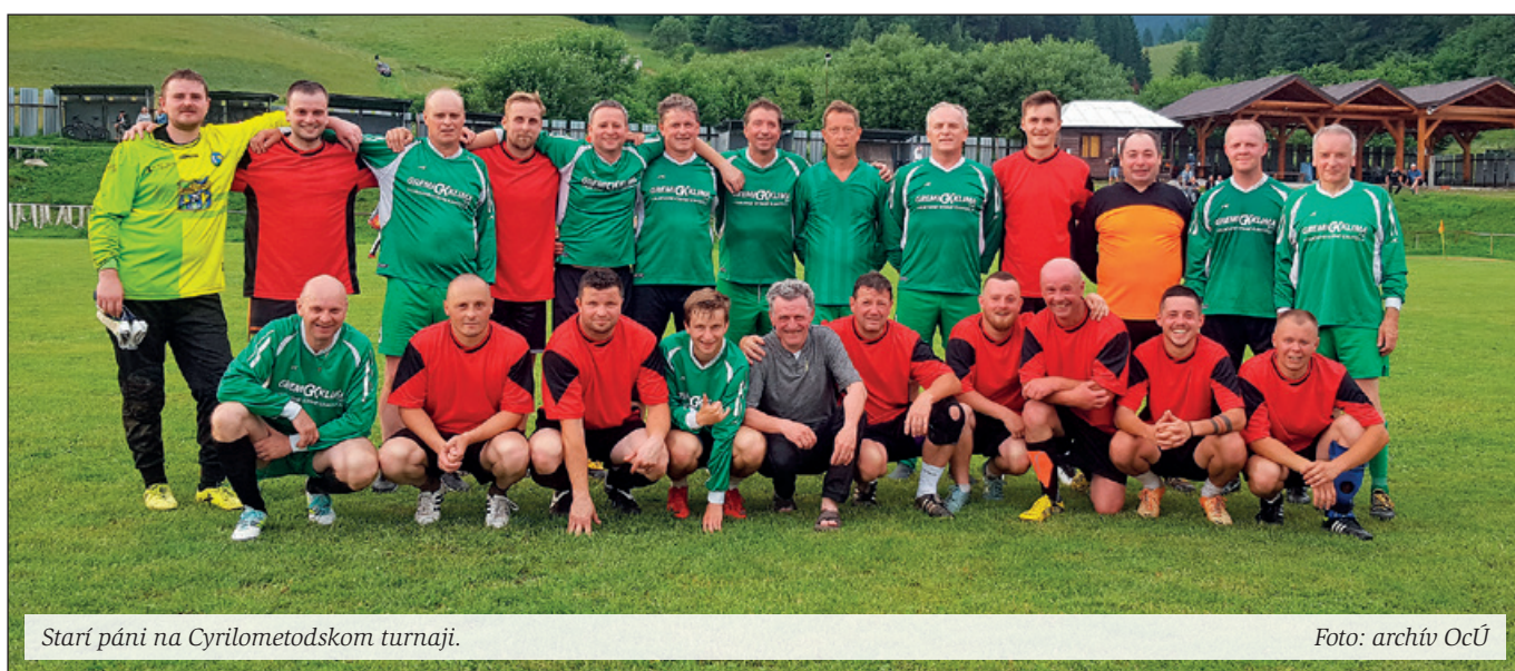
Starí páni na Cyrilometodskom turnaji.