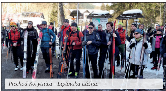
Prechod Korytnica - Liptovská Lúžna.