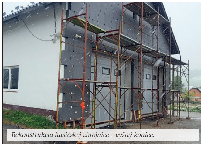
Rekonštrukcia hasičskej zbrojnice - vyšný koniec.