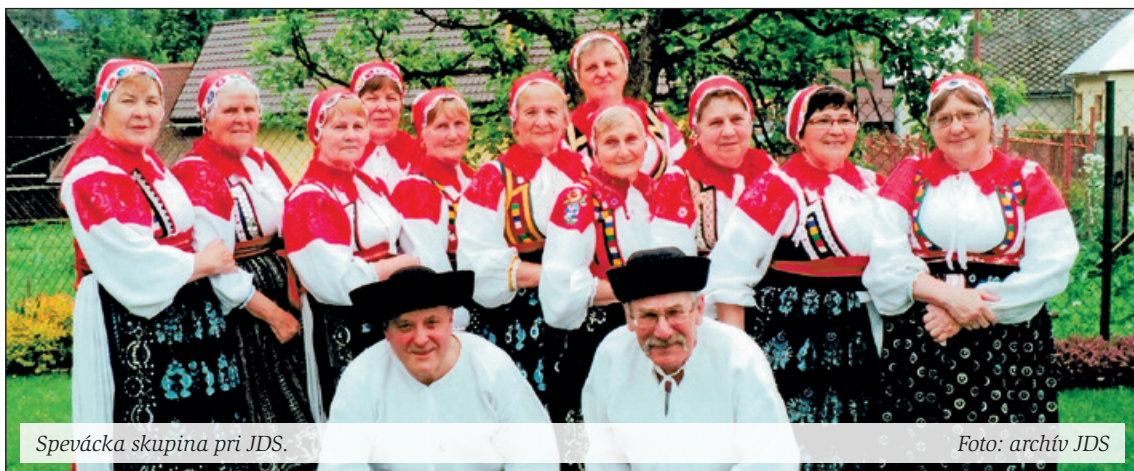
Spevácka skupina pri JDS.