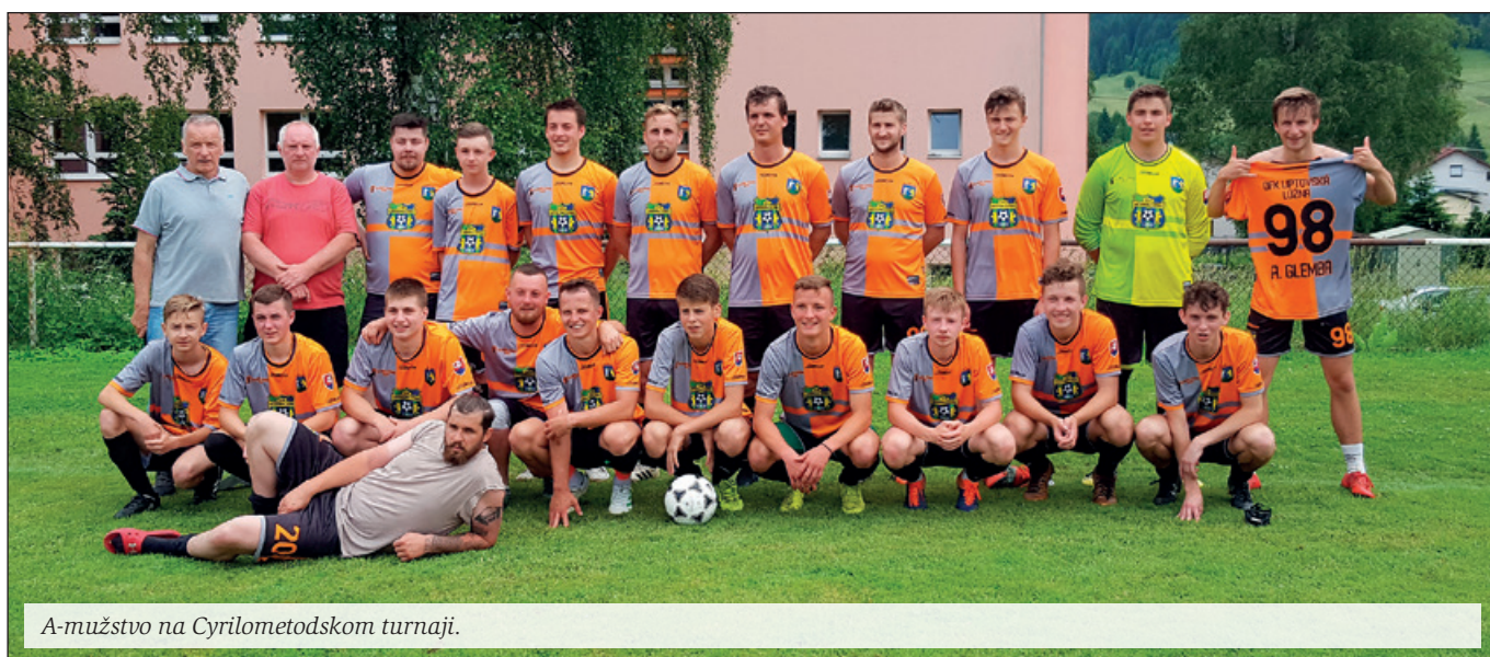
A-mužstvo na Cyrilometodskom turnaji.