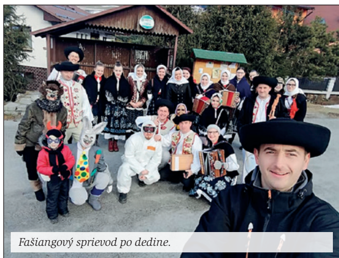
Fašiangový sprievod po dedine.

Folklórna skupina Lúžňan zahájila rok 2019 tradičnou bursou po dedine, ktorá sa konala 2. marca. Členovia FS Lúžňan spolu s dobrovoľníkmi roztancovali celú dedinu. Počasie nám prialo, občania boli dobre naladení, pohostinní a tak sme spolu všetci prežili veselú sobotu, ktorá končila fašiangovou zábavou v maskách v kultúrnom dome. Fašiangovanie Folklórnej skupiny Lúžňan pokračovalo 4. marca, kde sme prijali pozvanie Folklórneho súboru Liptov a tak sme sa spolu s nimi a bursovníkmi z iných dedín, ako napr. z Liptovských Revúc, Liskovej, Černej vyтворili fašiangovú pochôdzku po ružomberskom námestí. Po sprievode mestom sme pred obchodným centrom Adria a hotelom Kultúra predviedli krátky program, následne sme zamierili do Veľkej