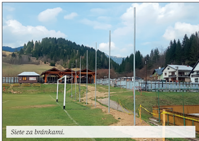
Siete za brámkami.