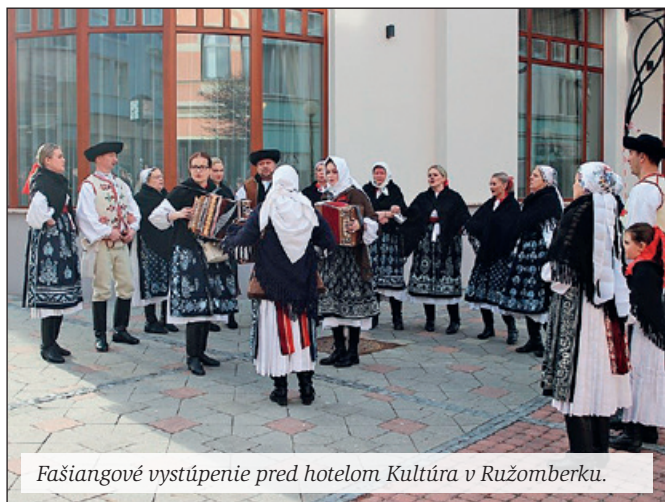
Fašiangové vystúpenie pred hotelom Kultúra v Ružomberku.