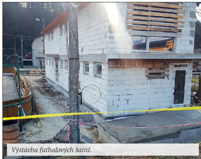
Výstavba futbalových šatní.