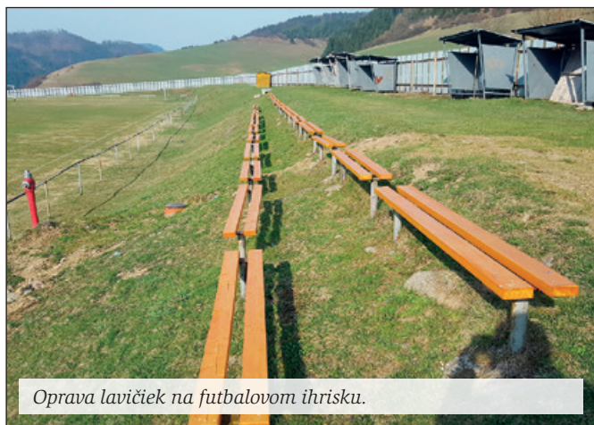
Oprava lavičiek na futbalovom ihrisku.