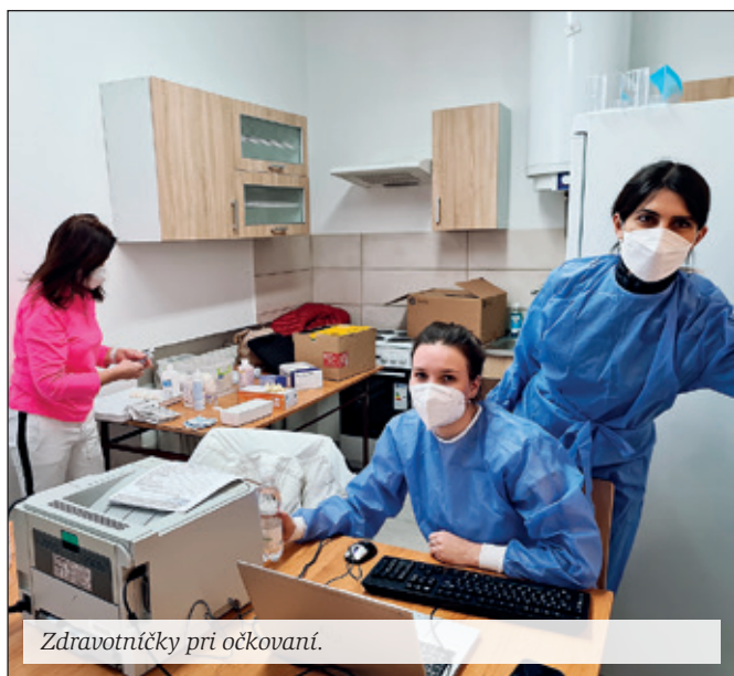
Zdravotníčky pri očkovaní.