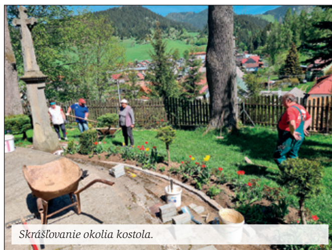
Skrášľovanie okolia kostola.