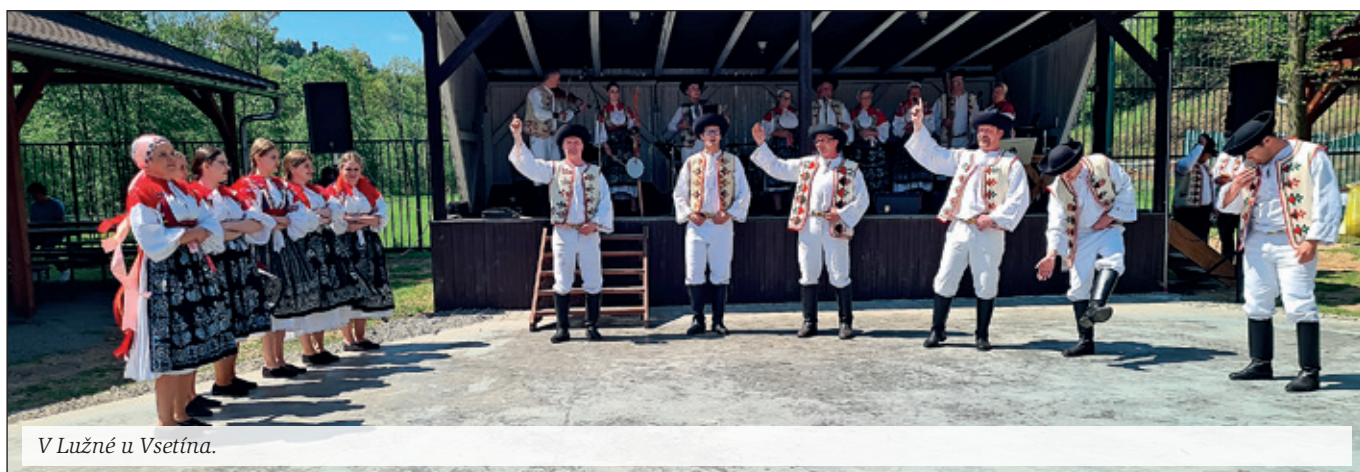
V Lúžné u Vsetína.