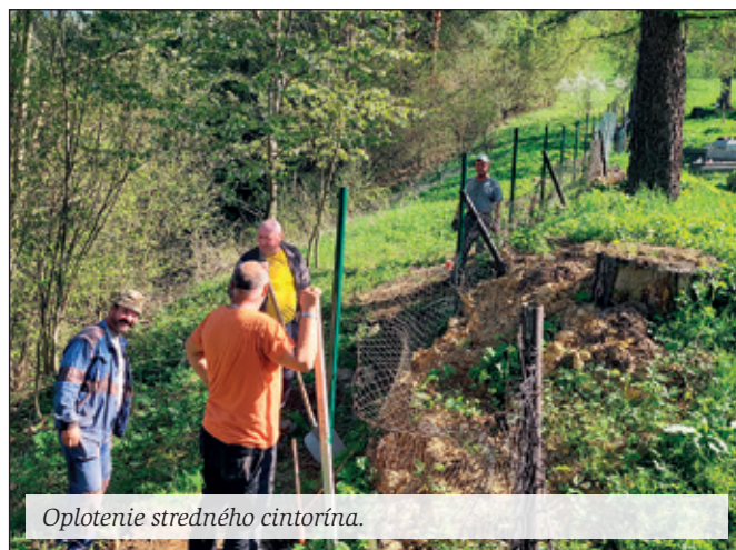
Oplotenie stredného cintorína.