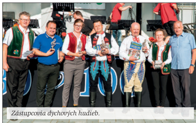
Zástupcovia dychových hudieb.