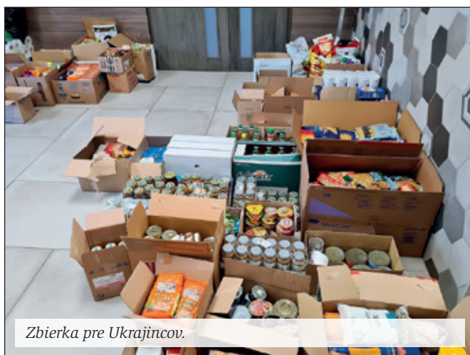
Zbierka pre Ukrajincov.