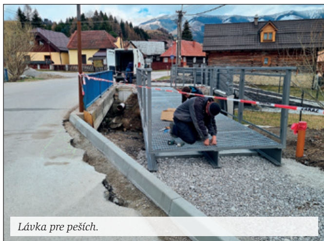
Lávka pre pešičh.