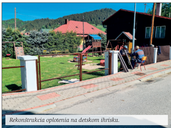
Rekonštrukcia oplotenia na detskom ihrisku.