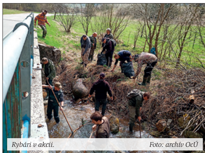
Rybári v akcii.