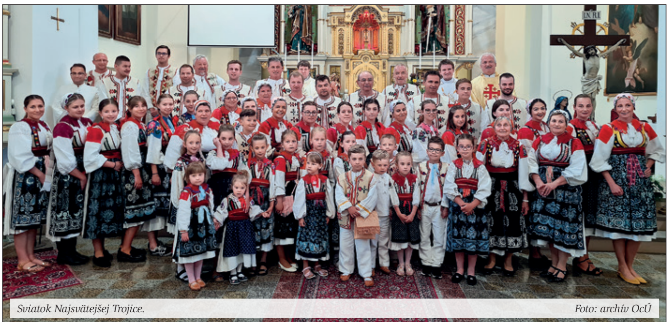
Sviatok Najsvätejšej Trojice.

Zaujímavý je aj ten fakt, že vedieť si oddýchnuť nie je naše právo, ale povinnosť. Prehnaná aktivita, do ktorej nás