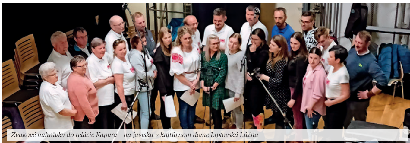
Zvukové nahrávky do relácie Kapura – na javisku v kultúrnom dome Liptovská Lúžna