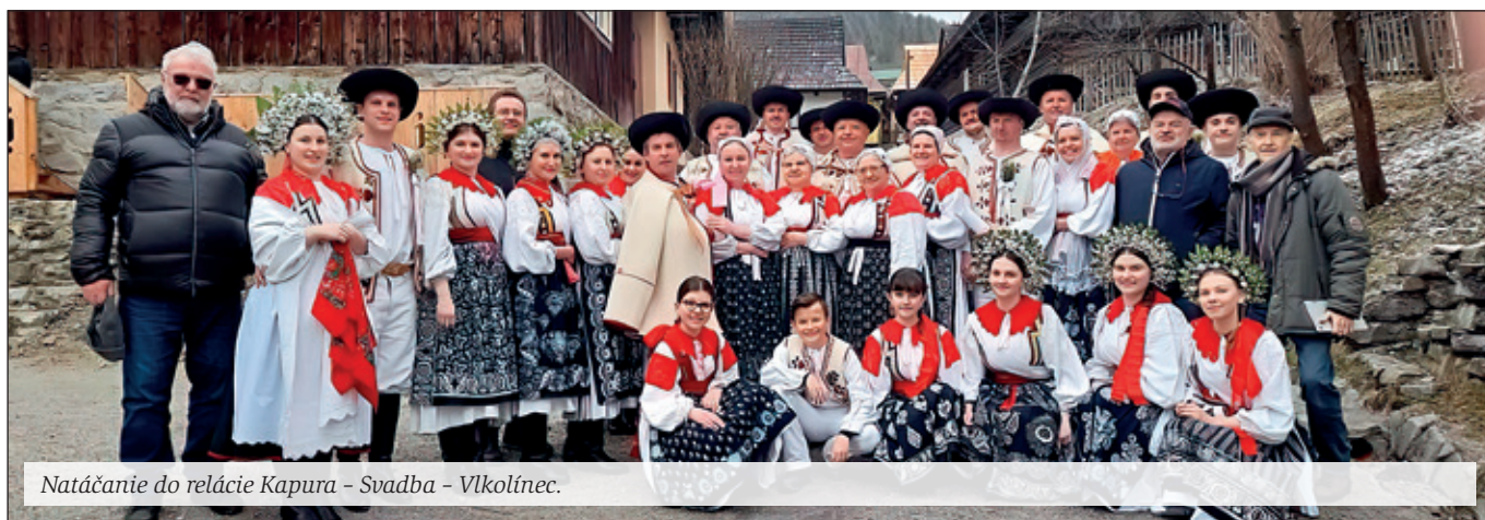
Natáčanie do relácie Kapura – Svadba – Vlkolíncec.