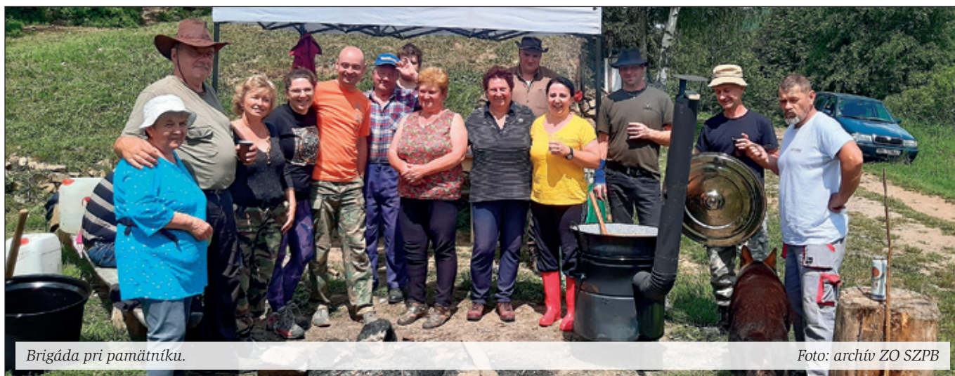
Brigáda pri pamätníku.